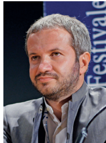
Claudio Borghi Aquilini

Parteciperanno compatibilmente con gli impegni istituzionali.