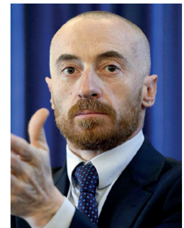
Jury Chechi Olimpionico