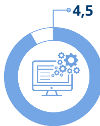
Valutazione facilità utilizzo strumenti formazione online Scala valore da 1 a 5