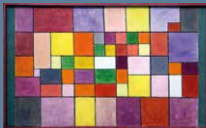
Paul Klee, Armonia della flora nordica , senza data.