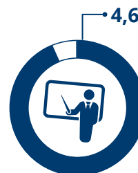
Valutazione docenti Scala valore da 1 a 5