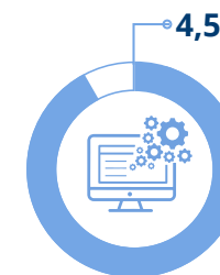
Valutazione facilità utilizzo strumenti formazione online Scala valore da 1 a 5